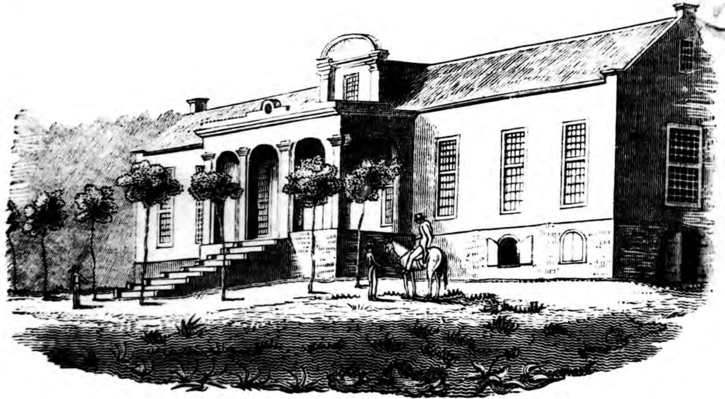
DIE DROSDY TULBAGH IN 1811

'n Voorstelling deur die Britse reisiger, W.J. Burchell