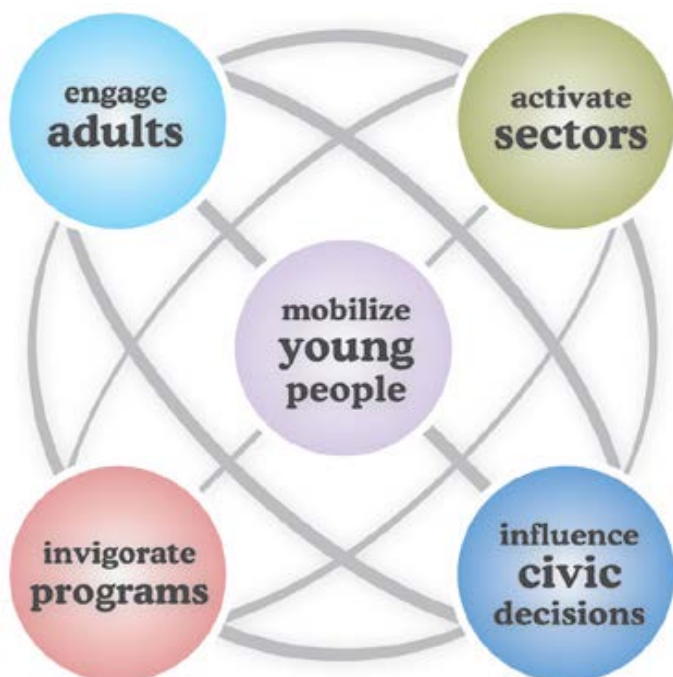
Figuur 5.1: Vyf aksie-strategieë vir die transformering van gemeenskappe en die samelewing (Search Institute 2006b).