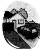
The car is parked in front of the house. Die motor is voor die huis geparkeer.