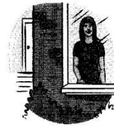
She is inside the house. Sy is binne-in die huis.

Voorsetsels word hoofsaaklik gebruik om ruimtelike verhoudings aan te dui, soos byvoorbeeld "op," "onder," "in," "bo," "voor," "oor" ensovoorts. Ruimtelike verhoudings kan beter deur die nie-verbale aanduiders (illustrasies) aangedui word omdat dit dikwels ingewikkeld is om hierdie verhoudings in woorde om te sit. Illustrasies word effektief in bestaande voorbeelde gebruik omdat dit die ruimtelike verhouding of aksie wat beskryf word beter aan die teikengebruiker verduidelik deur middel van 'n visuele illustrasie. Dit is 'n baie geslaagde metode vir nultaalsprekers; nie slegs vir die aanduiding van voorsetsels nie, maar ook om hierdie gebruikers bewus te maak van die korrekte gebruik van Afrikaanse voorsetsels. Die gebruik van illustrasies dien dus as aanvulling en ondersteunende leiding vir die voorbeeldsinne wat verskaf word. Alhoewel Longman-HAT se woordeboek goeie leiding ten opsigte van voorsetsels bied, kan daar beweer word dat weens die tekort aan 'n woordeboekkultuur, wat woordeboekvaardighede insluit, die studente bloot nie hierdie leiding in die gegewe middeltekste ontdek het nie.