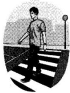
There's a boy walking across the street. Daar is 'n seun wat oor die straat stap.

Longman-HAT se woordeboek bied verdere leiding ten opsigte van voorsetsels in die middeltekste aan. Hierdie suksesvolle leiding word soos volg aangebied: