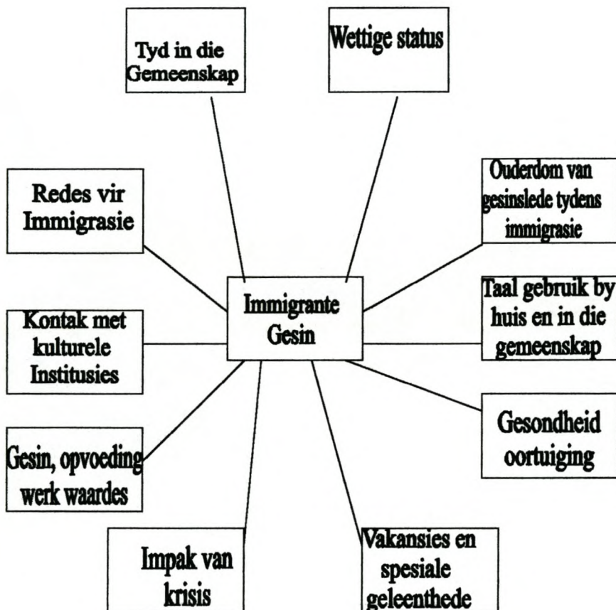
Figuur 5.3 : Culturagram : (Congress, 1994 :531)

Figuur 5.3 word aangebied om die “culturagram” te verduidelik.