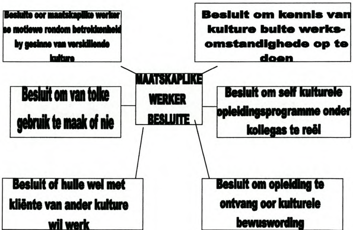
Figuur 6.2 Besluite wat maatskaplike werkers moet neem tydens dienslewering

van watter kulturele oorsprong hulle is nie. Deurdad die maatskaplike werkers hulle vermoëns ontwikkel, stel hulle hulself in staat om effektiewe dienste aan alle kultuurgroepe te lewer. Die maatskaplike werkers kan dus self besluit om hulle inligting en ondervinding van verskillende kulture te verbreed. Hulle kan ook besluit om hulle vermoëns ten opsigte van die hantering van gesinne met diverse kulture, te ontwikkel. Hulle kan besluit om hulle persoonlike en institusionele bronne te benut, byvoorbeeld deur vriende te kontak wat van 'n spesifieke kulturele agtergrond is, ten einde insig te ontwikkel. Hulle kan self besluit om hulle houdings en verwagtinge te verander. Hulle kan besluit om hulle status met hulle kliënte te ondersoek. Die maatskaplike werkers kan besluit om hulle kollegas se kennis van kulturele en transkulturele sake te verbreed. Die maatskaplike werkers het dus heelwat vryheid tot besluitnemings. Volgens D'Ardenne (1989:42-43) moet maatskaplike werkers ook die volgende besluite maak, wanneer hulle dienste lewer aan 'n spesifieke kliënt van 'n ander kultuur of kulture. Die besluite sal in Figuur 6.2 uiteengesit word.