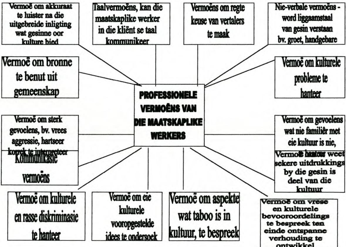
Figuur 6.1 Professionele vermoëns van die maatskaplike werkers

'n Belangrike aspek wat D'Ardenne (1989:40) uitlig is die professionele vermoëns waarvoor maatskaplike werkers moet beskik om dienslewering te vergemaklik aan gesinne met diverse kulturele agtergronde. Dit sal in figuur 6.1 aangebied word.