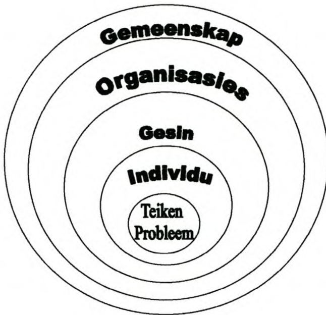
Figuur 5.1 :Sisteen en Teiken probleme :(Tolson, Reid en Garvin, 1994 :7)

Onderzoek na die verskillende sisteme binne die konsentriese sirkels in Figuur 5.1, stel die maatskaplike werkers in staat om die effek van elk op die probleme te bepaal. Die probleem het ook 'n effek op elk van die verskillende sisteme. Dit is dus belangrik om die impak van elk van die sisteme op die oplossing van die probleem te bepaal. Ten einde die effek van die probleem op die sisteme vas te stel, moet aandag aan die volgende drie vrae gegee word, naamlik eerstens wat is die rol van die sisteem in die oorsaak en en die oplossing van die probleem. Tweedens wat die impak van die probleem op elk van die sisteme is en derdens wat kan elk van die sisteme bied om die probleem op te los (Tolson, Reid en Epstein, 1972:6-8)?