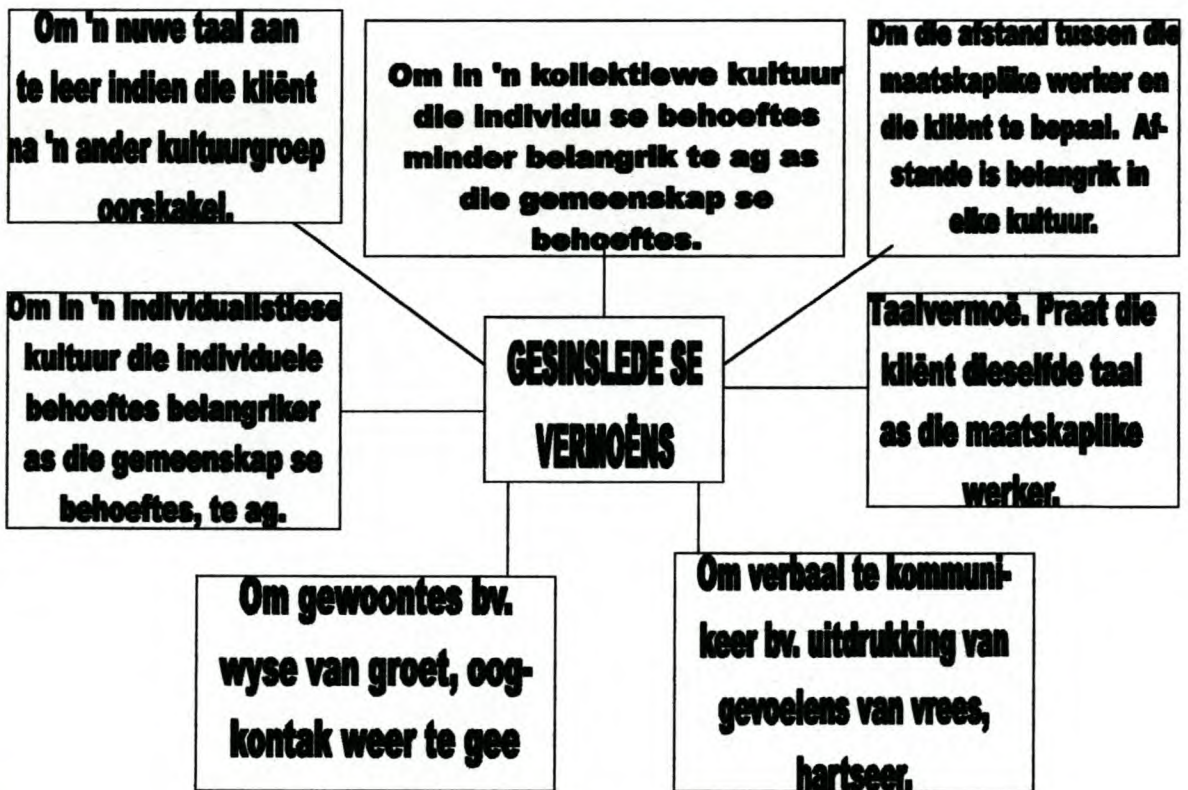
Figuur 6.3 Die gesin se vermoëns

Hier volg 'n uiteensetting in figuur 6.3 van die gesin van diverse kulture se vermoëns wat in ag geneem moet word deur die maatskaplike werker tydens dienslewering.