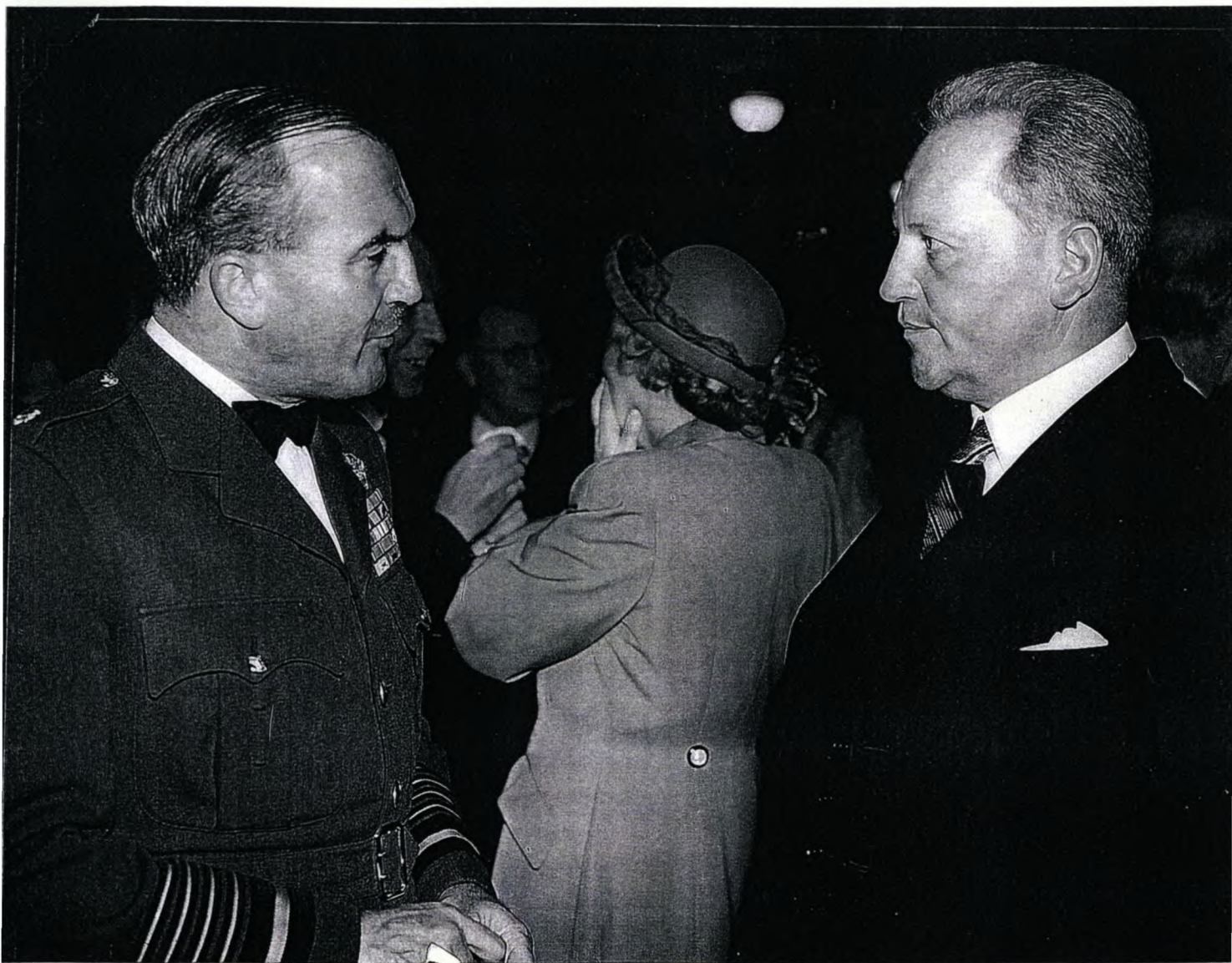
Minister F.C. Erasmus (regs) gedurende sy besoek aan Londen om die Statebondskonferensie vir Ministers van Verdediging by te woon – Junie 1951.