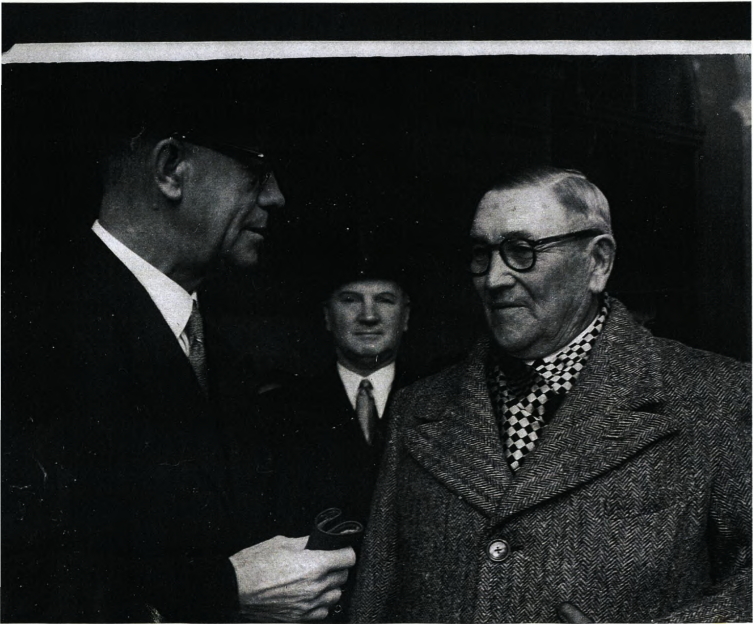
Dr. A.L. Geyer saam met Minister N.C. Havenga, Minister van Finansies gedurende sy besoek aan Londen – Augustus 1952.