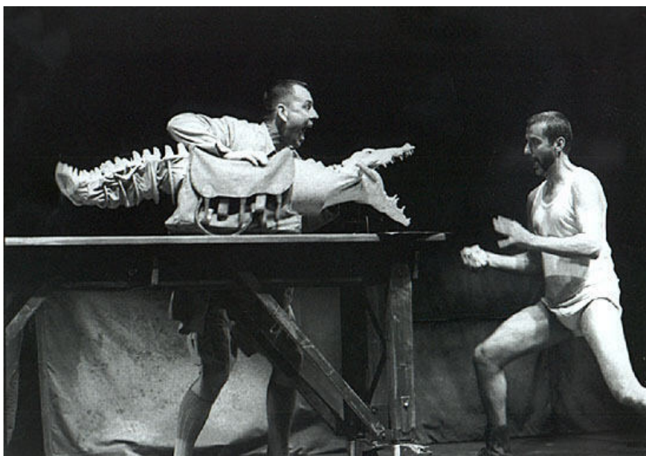
Foto 2: Die krokodil in Ubu and the Truth Commission.

Uit al die gegewe omskrywings kan afgelei word dat die toneelpop enige voorwerp kan wees, insluitende voorwerpe wat nie primêr toneelpoppe is nie. In teenstelling met 'n outomaat moet die toneelpop deur 'n mens gemanipuleer word om deur middel van beweging verlewendig te word. Daar is verskillende manipulasie-metodes waarmee toneelpoppe verlewendig word. Die toneelpop kan met behulp van toue, drade, stawe of net die manipuleerder se hand, selfs sy voet in die geval van die Koreaanse voetpop, gemanipuleer word (Jones 1987:14). Toneelpoppe kan ook verskil in grootte. Die toneelpop is egter altyd 'n nie-geanimeerde voorwerp wat deur 'n manipuleerder verlewendig word. Die manipuleerder is onontbeerlik, want daarsonder sou die toneelpop nie oor spraak of beweging kon beskik nie. Spraak, ontwerp? en beweging maak 'n integrale deel uit van die toneelpop se animasie. Die manipuleerder se vaardighede en kreatiewe denke is bepalend tot die mate waartoe die toneelpop in die verbeelding van die gehoor 'n vorm van lewe aanneem en sekere gedagtes, idees, kritiek, stories of emosies oortuigend oordra.