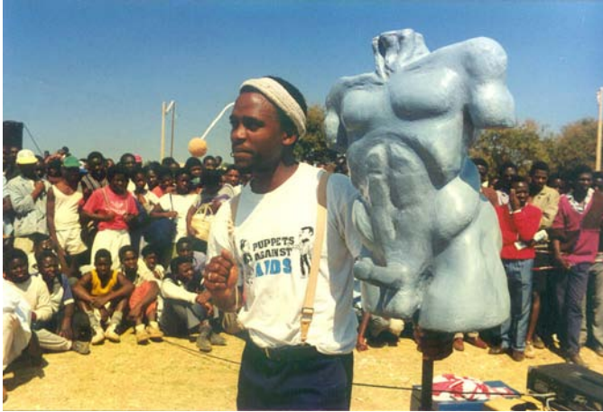
Foto 3: 'n Kondoomdemonstrasie as deel van Puppets against AIDS deur arepp.

Puppets against AIDS was in werklikheid straatteater wat toneelpoppe gebruik het. Geen vooraf publisiteit vir die produksie is gedoen nie en die opvoering het in publieke ruimtes, onder andere in busstasies en voor besige sakepersele, plaasgevind. Die skare is met behulp van musiek (onder andere tromme) nader gelok. Bim Mason (1992:13) verduidelik die doel en noodwendige aanslag van straatteater as volg: