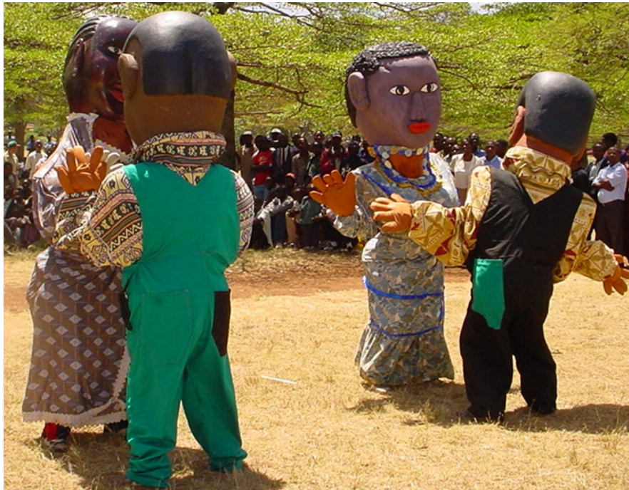
Foto 1: Reusegrootte toneelpoppe uit CHAPS se Edupuppets projek in 2004 (Foto deur Tony Mboyo. Bron: Privaat korrespondensie, 2006 a).

Daar is 'n duidelike samehang tussen die konstruksie, grootte en manipulasieposisie van toneelpoppe. Taylor (1966:43) stel dit baie bondig met betrekking tot handpoppe en klein staafpoppe teenoor marionette: