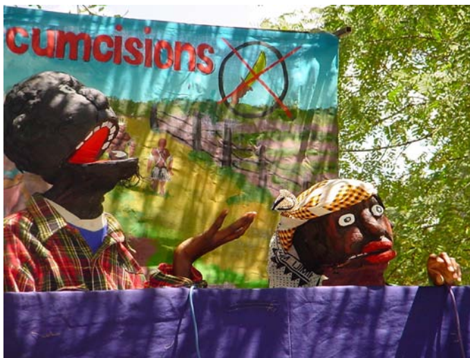
Foto 4: Toneelpoppe uit CHAPS se opvoering teen besnyding.

Die doel van CHAPS as 'n FPPS-program is om sosiale probleme deur middel van poppeteater aan te spreek. 'n Bepaalde opvoering word op 'n bepaalde gemeenskap en sy probleme gerig en in die taal van die bepaalde gemeenskap aangebied. Algemene probleme wat deur CHAPS aangespreek word, is MIV/VIGS, gebrekkige gesinsbeplanning, vroulike geslagsmutilasie, tradisionele besnydenis, korrupsie, mense- en vroueregte, geslagsongelykheid en dwelmmisbruik, asook omgewing- bewaringsake. Hierdie is die probleme wat Keniane in die algemeen ondervind, hoofsaaklik omdat dit so 'n tradisiegerigde land is en omdat bogenoemde kwessies deur die tradisies in Kenia onderskryf word.