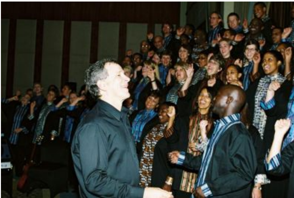
Fig. 4 Die Stellenbosch Libertaskoor, 2006