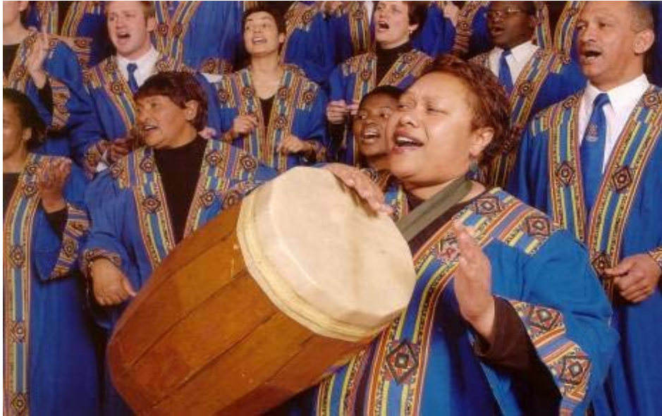
Fig. 5 Die Libertaskoor in togas, 1996

Louwina de Villiers het vertel dat die swart mense in die koor nie baie tevrede met die toga was nie. Dit was te formeel vir die danse wat saam met die Afrika-liedere gedoen is. Die koordrag is dus later uitgebrei na nog 'n kledingstuk in die vorm van 'n kaftan met 'n wit kantborduursel op die bors – en op 27 April (Vryheidsdag) 1995 het die koor die eerste keer daarin opgetree (Louwina de Villiers, 2007, 5 September).