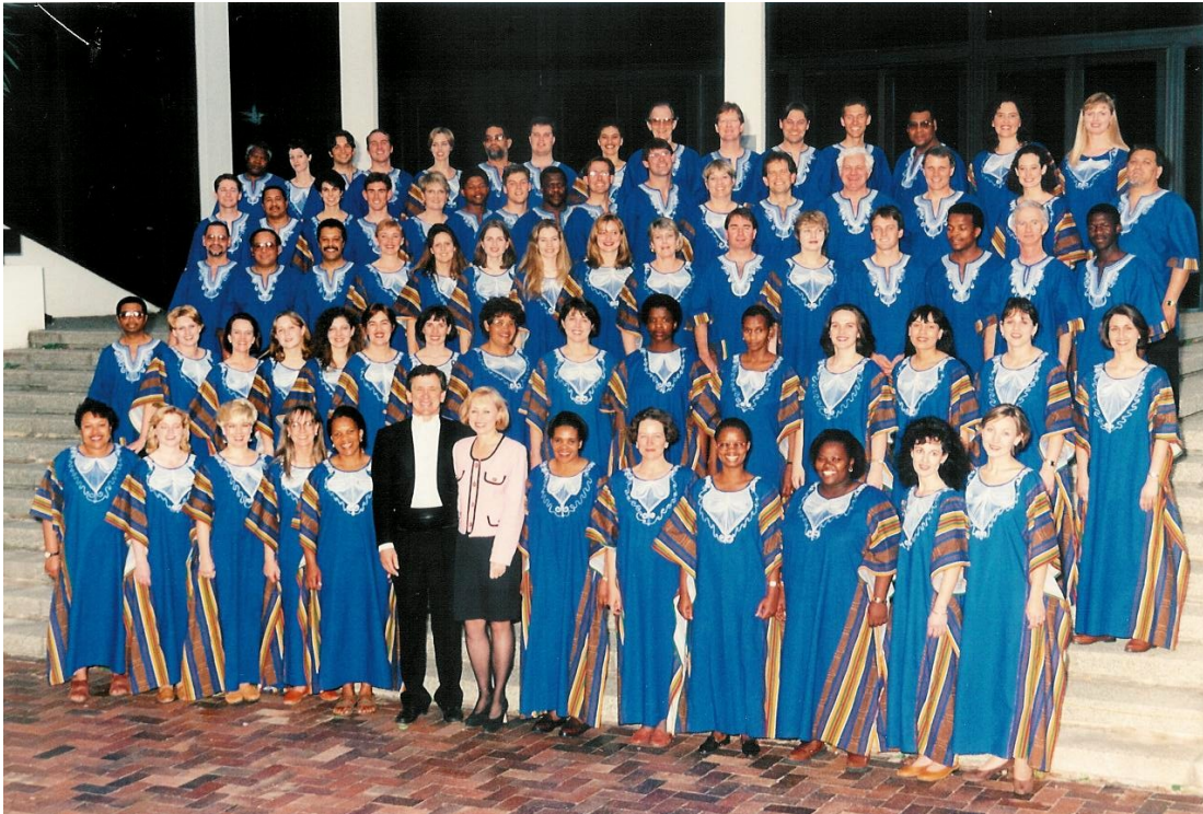
Fig. 1 Die Libertaskoor voor die Endlersaal, Konservatorium, Stellenbosch (datum onbekend)