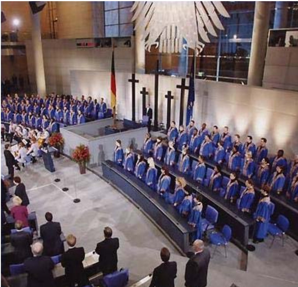
Fig. 3 Die Stellenbosch Libertaskoor in die Reichstag, Berlin in 2004