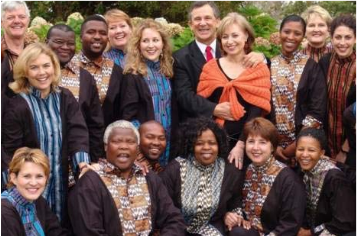
Fig. 7 Nuwe kleredrag in 2006

Die kaftan het met jare se dra en was begin vaal en vormloos raak. Uit die gehoor uit het die some boonop ongelyk vertoon – en dit het van die koorlede gepla, want 'n koor moet mos netjies lyk! Maar, soos kinderskoene ontgroeï word, het die koor se rol algaande méér begin insluit as om net ambassadeurs en brugbouers te wees.