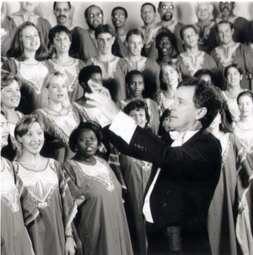
Fig. 2 Die Transnet Libertaskoor, 1997