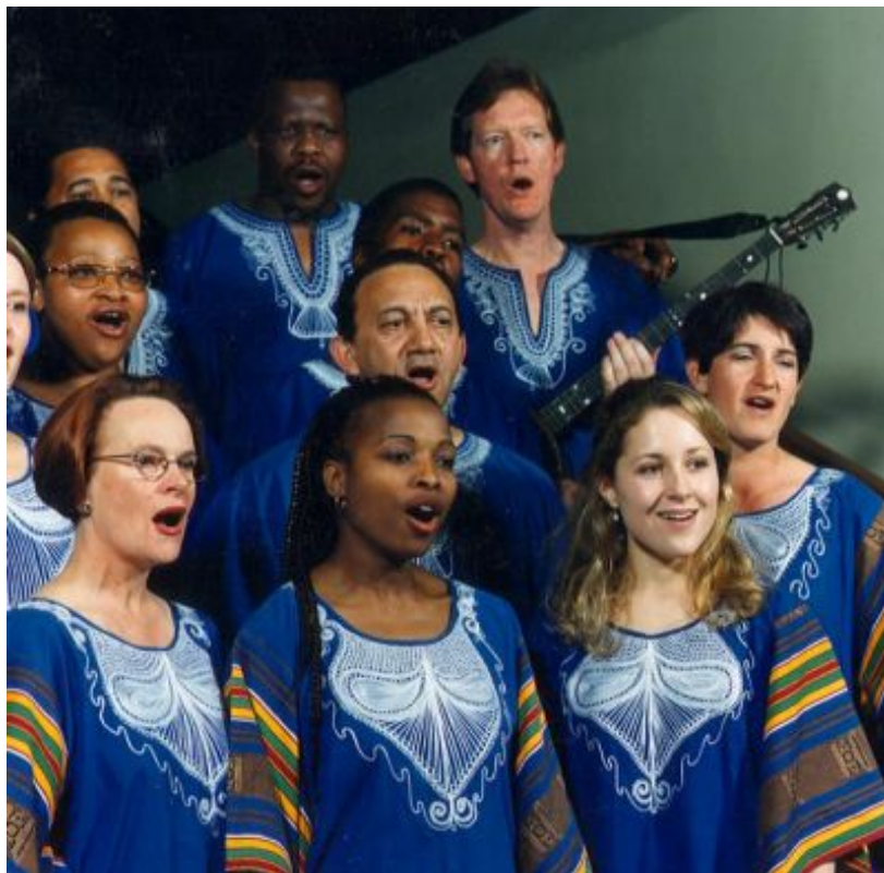
Fig. 6 Die Libertaskoor in etniese kaftans, 1997

Louwina de Villiers het vertel dat die swart mense in die koor nie baie tevrede met die toga was nie. Dit was te formeel vir die danse wat saam met die Afrika-liedere gedoen is. Die koordrag is dus later uitgebrei na nog 'n kledingstuk in die vorm van 'n kaftan met 'n wit kantborduursel op die bors – en op 27 April (Vryheidsdag) 1995 het die koor die eerste keer daarin opgetree (Louwina de Villiers, 2007, 5 September).