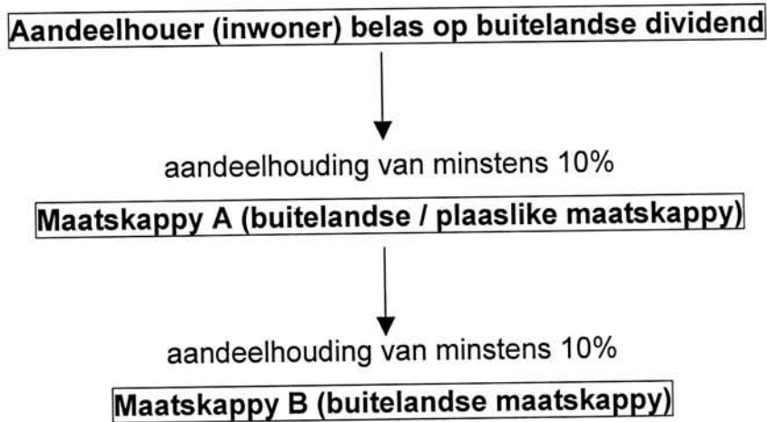
Figuur B.1 SKEMATIESE VOORSTELLING VAN DIE TOEPASSING VAN ARTIKEL 9E(4)

'n Inwoner van Suid-Afrika sal dus, vir die doeleindes van artikel 9E(4) 'n kwalifiserende belang van minstens 10 persent in maatskappy A besit, en aangesien maatskappy A op sy beurt weer 'n kwalifiserende belang in maatskappy B het, sal die inwoner ook 'n kwalifiserende belang (van minstens 1 persent) in maatskappy B besit. Wanneer maatskappy B dus 'n buitelandse dividend verklaar aan maatskappy A en maatskappy A verklaar 'n dividend aan die inwoner, moet die opgeskaalde proporsionele gedeelte van die dividende (of die onderliggende wins) verklaar deur maatskappye A én B in die inkomste van die inwoner ingesluit word. Die aandeelhouer (inwoner) sal dus ingevolge hierdie artikel op die opgeskaalde dividend (onderliggende wins) van beide Maatskappy A en B belas word, aangesien hy 'n kwalifiserende belang in beide maatskappye besit. Die bedrag ingesluit by bruto inkomste sal proporsioneel bepaal word volgens die persentasie belang van die aandeelhouer in maatskappy A (10 persent) en in maatskappy B (1 persent). Die opgeskaalde dividend (onderliggende wins) ingesluit in die inkomste van die inwoner sal dus in die geval van maatskappy A en B die dividend na terugtelling van terughoubelasting en buitelandse maatskappybelasting wees.