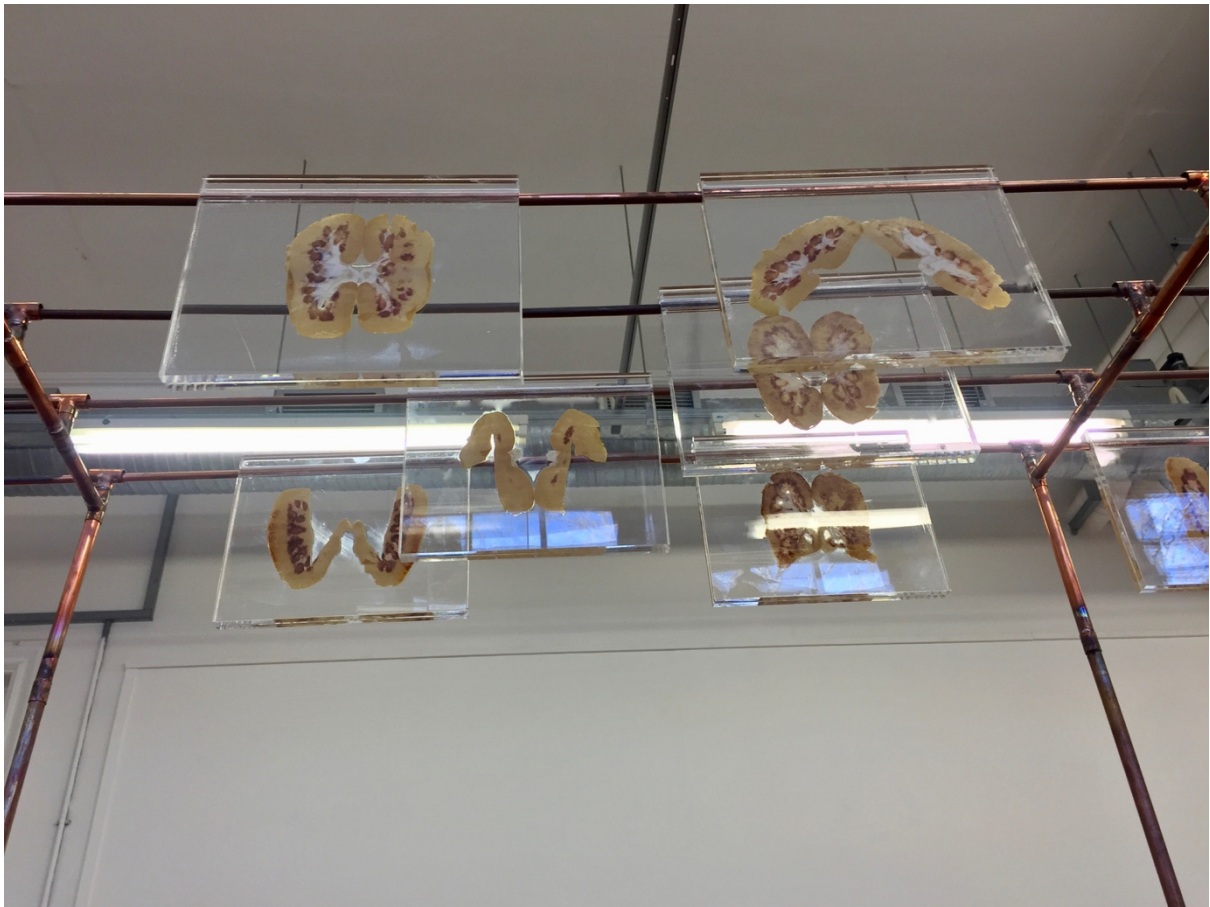
Figuur 2. Marguerite Kirsten, Besinning (Detail), (2019). Installasie.