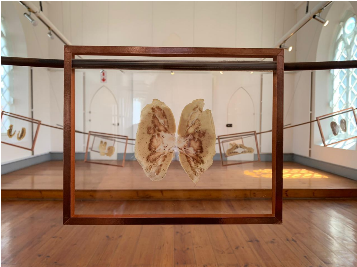
Figure 16. Marguerite Kirsten, Besinning (Detail) , (2019). Installasie.

word, het baie doeleindes, betekenis, en waarde vir die kunstenaar asook vir die betragtersgehoor.