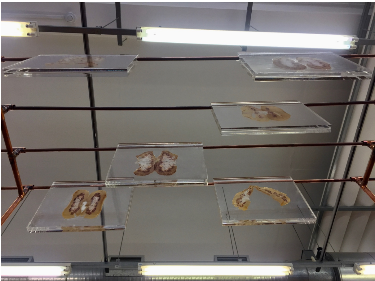
Figuur 12. Marguerite Kirsten, Besinning (Detail), (2019). Installasie.