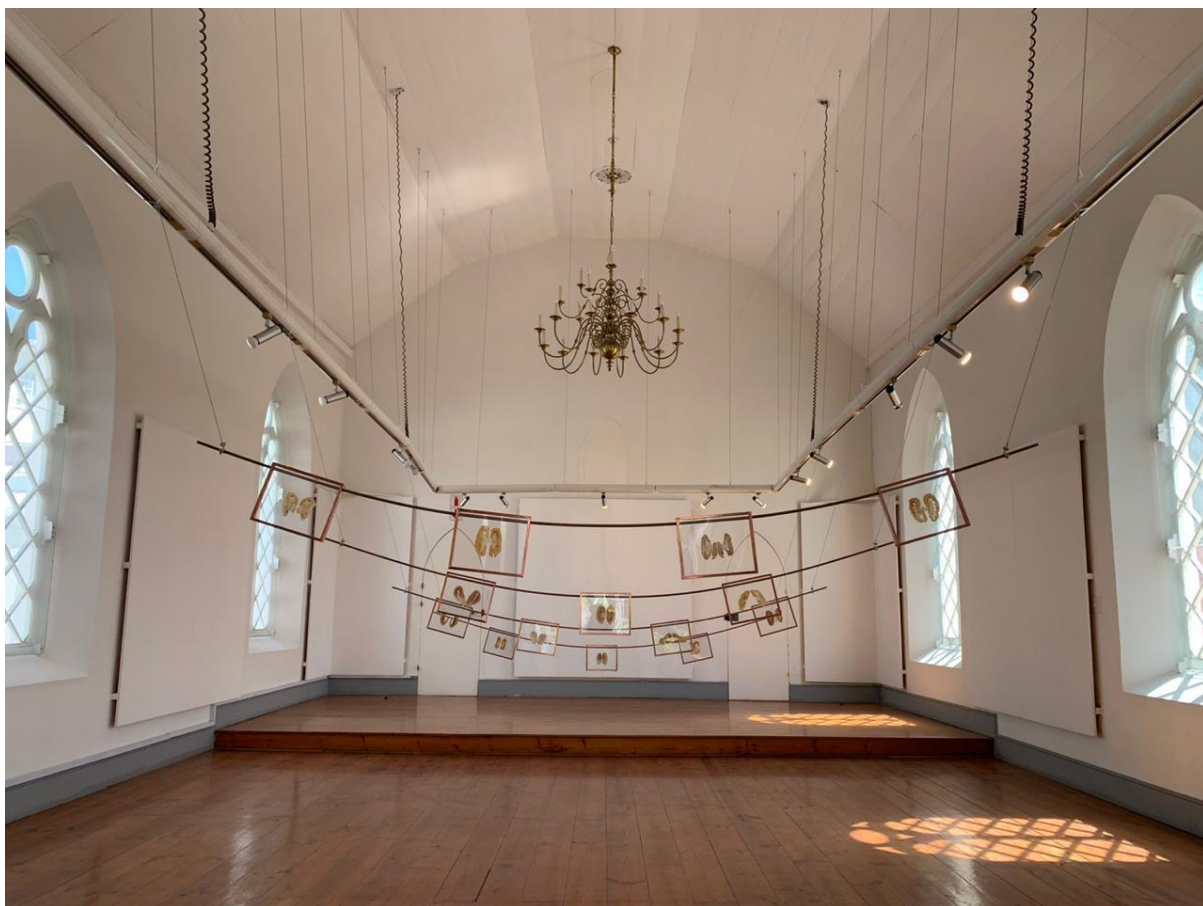
Figure 15. Marguerite Kirsten, Besinning , (2019). Installasie.