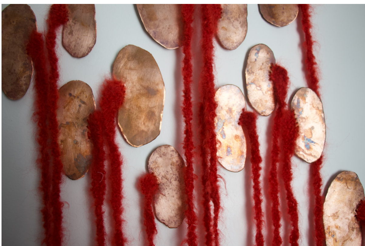
Figure 4. Marguerite Kirsten. Waiting Room, (2019). Mixed Media.