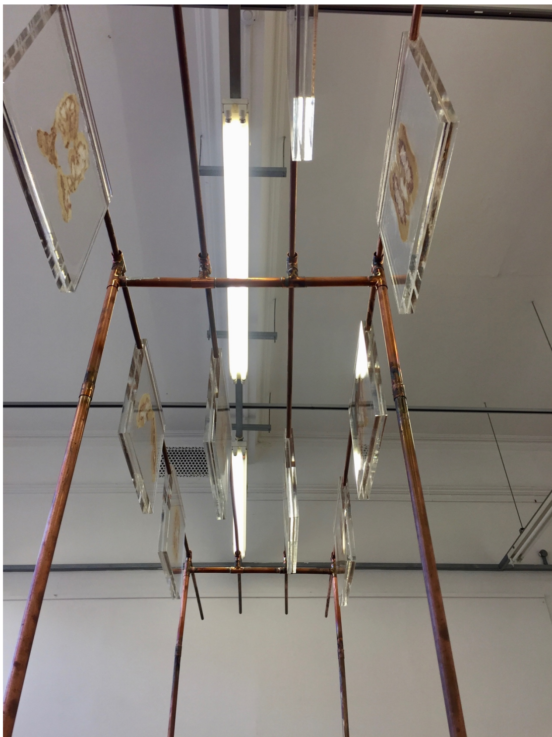
Figuur 13. Marguerite Kirsten, Besinning (Detail), (2019). Installasie.