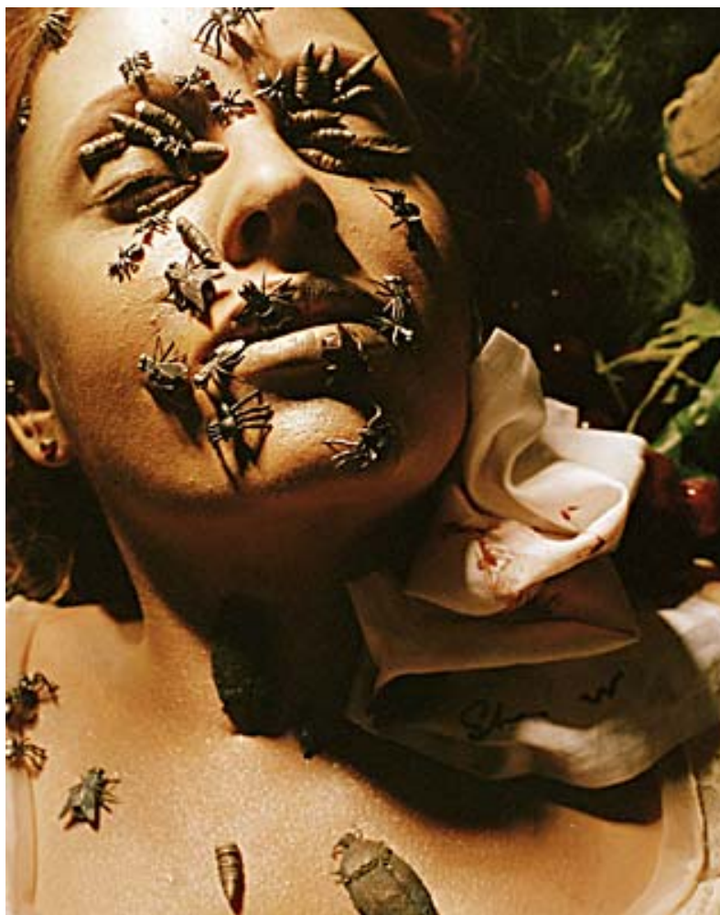
Figuur 7. Kathryn Smith, Memento Mori (detail), (2004). Reeks kleur fotos.