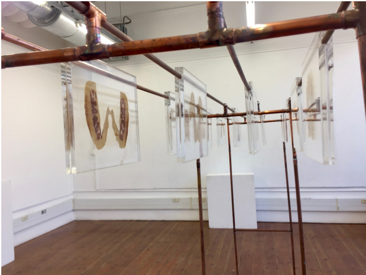
Figuur 14. Marguerite Kirsten, Besinning (Detail), (2019). Installasie.

middel van visuele kuns begryp is, is dit makliker om die ervaring van die 'abject' en siek liggaam te verstaan, ook vir die gesonde kyker. Hierdie insig sal verder in Hoofstuk Twee bespreek word.