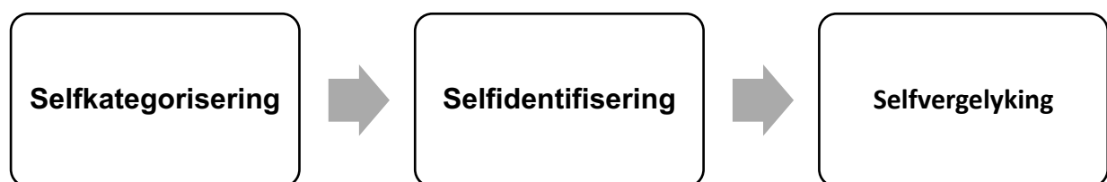
Figuur 2: Drie stadia van kognitiewe prosesse

Die groep het die inherente vermoë om die wêreld waarin hulle funksioneer te transformeer deur die verskeie individue wat 'n eenheid vorm. Die transformasie kan positief van aard wees en ook toegepas word in geloofsgemeenskappe, maar dié aspek word later in die studie in meer diepte ondersoek. 39 Die doelgerigte groepsgedrag gee aanleiding tot transformasie en maak sodoende 'n paradigmaskuif moontlik. Sosiale identiteit is volgens Tajfel en Turner die kognitiewe meganisme wat groepsgedrag moontlik maak (1979:47). Met betrekking tot mense met gestremdhede sou die uitdaging wees om die grense van die groep sodanig te verskuif dat dit ook hierdie lede van die gemeenskap insluit. Volgens McLeod is daar drie stadia van kognitiewe prosesse wat die 'ons' en 'hulle' in kategorieë plaas (McLeod, 2008).